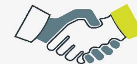
Personalangelegenheiten der Richter und des nichtrichterlichen Dienstes