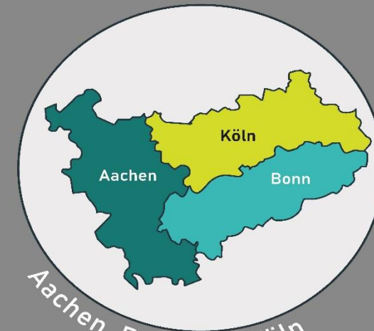
Aachen, Bonn und Köln

Die 3 Landgerichtbezirke sind Köln mit 9 Amtsgerichten, Aachen mit 8 Amtsgerichten und Bonn mit 6 Amtsgerichten.