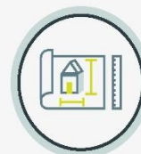
Bau- und Architektensachen