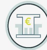
Bank- und Finanzsachen