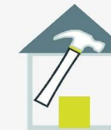
Bau- und Haushaltsangelegenheiten